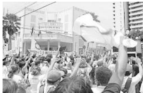
Aproximadamente 600 alunos do CEFET participaram de uma passeata de protesto do Midway Mall até a Câmara

alternativa seria construir uma passarela em “L”. Dessa forma, não comprometeria o bosque. Com palavras de ordem do tipo: “O povo agita pra dizer que o bosque fica”, os alunos que participaram da reunião ontem pela manhã também participaram antes da reunião que envolveu toda a comunidade do CEFET que apresentou negativa ao projeto da STTU. “O projeto prevê destruir a quase totalidade do bosque do Centro. Desde 2001, o projeto foi apresentado e, a partir de 2002, o CEFET apresenta alternativas. O que não podemos aceitar é que vereadores falem em nome